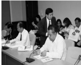
ผู้เข้าร่วมระดมความคิดเห็นกลุ่มผังเมือง