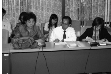
เจ้าหน้าที่จากหน่วยงานต่างๆ เข้าร่วมสัมมนา