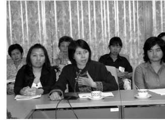
ประชาชนที่ได้รับผลกระทบจากการรักษาพยาบาล และผู้ให้ข้อมูลจากหน่วยงานด้านสาธารณสุข