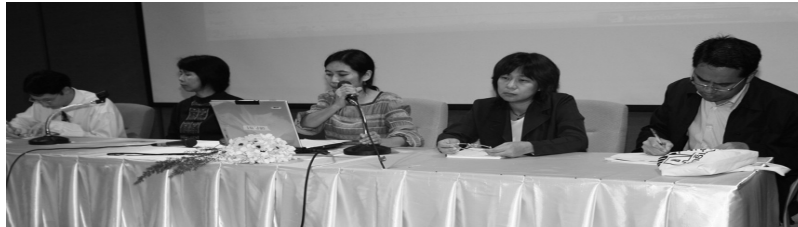
ผู้แทนทั้ง 5 กลุ่ม นำเสนอผลการระดมความคิดเห็นของแต่ละกลุ่ม