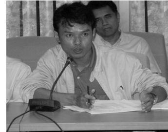
ชาวบ้านที่ประสบปัญหาผังเมืองจาก จ.ประจวบคีรีขันธ์ ร่วมแสดงความคิดเห็น