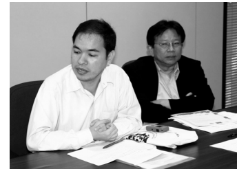
ทุกกลุ่มมีบุคลากรจากสำนักงานคณะกรรมการข้อมูล ข่าวสารของราชการ คณะกรรมการสิทธิมนุษยชน แห่งชาติ และสหภาพนายความร่วมมือให้ข้อมูล